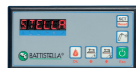
Console comandi Control panel