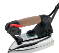
Dotazione ferro da stiro mod. EOS (fornito standard) Supplied with EOS iron (standard equipment)