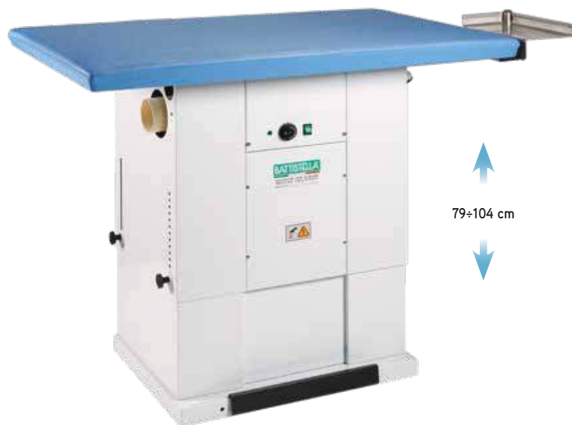
Piano stiro inclinato (su richiesta) Tilted ironing board (by request)