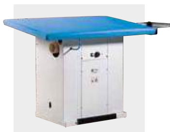
Piano stiro inclinato (su richiesta) Tilted ironing board (by request)

HEATED, VACUUM AND BLOWING RECTANGULAR IRONING BOARD