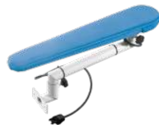
Braccio stiro aspirante Vacuum ironing arm