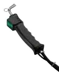
Pistola vapore Steam pistol