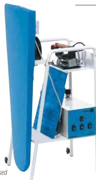
Chiuso - Closed