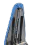
Molla a gas Gas spring