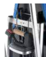
Supporto ferro Iron support