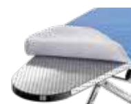
Piano stiro in alluminio Aluminium ironing board