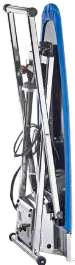
Chiuso - Closed