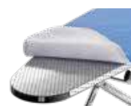
Piano stiro in alluminio Aluminium ironing board