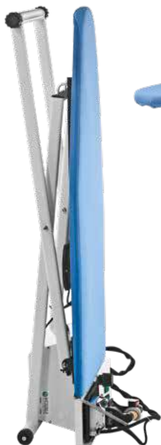
Chiuso - Closed