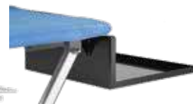
Abbassamento poggiaferro Lower iron rest