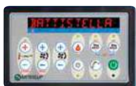
CONSOLLE COMANDI - CONTROL PANEL