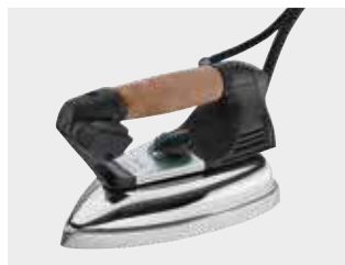
Ferro da stiro mod. EOS (fornito standard) Eos iron (standard equipment)