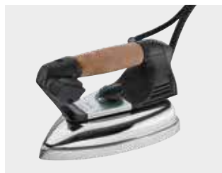
Ferro da stiro mod. EOS (fornito standard) Eos iron (standard equipment)