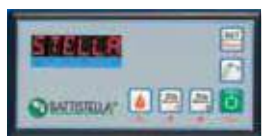
CONSOLLE COMANDI - CONTROL PANEL

Braccio stiro aspirante - Vacuum ironing arm Kit gettoniera - Coin mechanism Kit pistola aria/vapore - Steam/air gun kit Kit pistola vapore - Steam gun kit