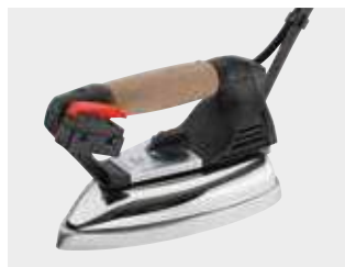
Ferro da stiro mod. EOS PRO (fornito standard) EOS PRO iron - (standard equipment)