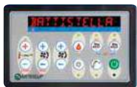
CONSOLLE COMANDI - CONTROL PANEL